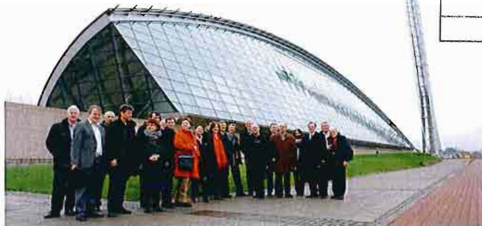
Prosjektet besøker Glasgow Science Center høst 2008