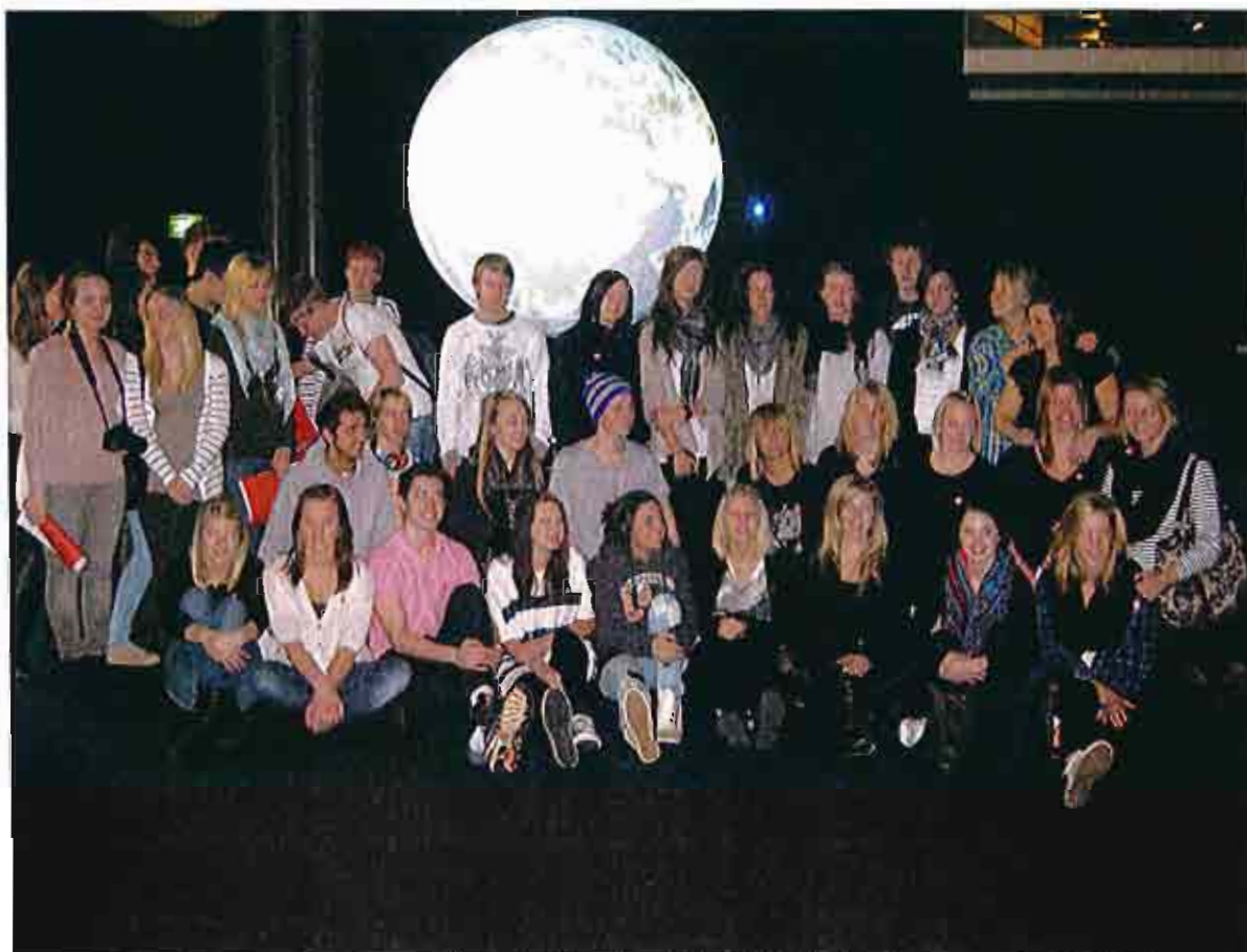
Svenske og norske elever på evalueringsbesøk hos EUREKA science centre i Finland